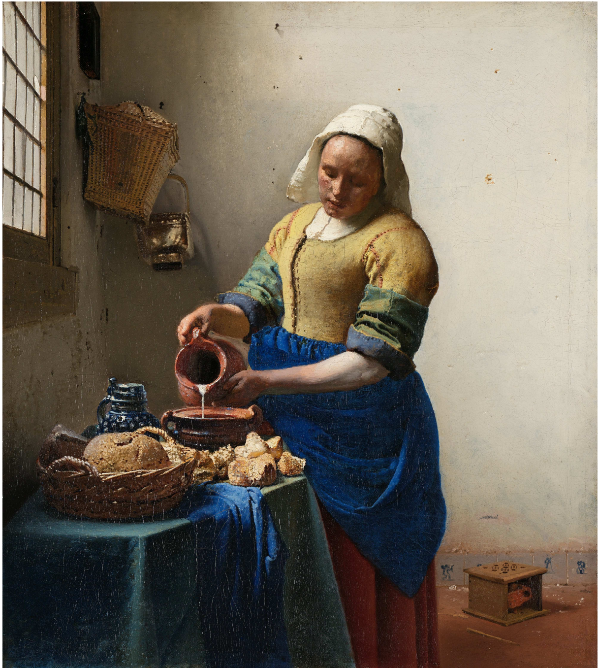
Jan Vermeer, Het melkmeisje (Die Milchmagd / um 1658-1660)